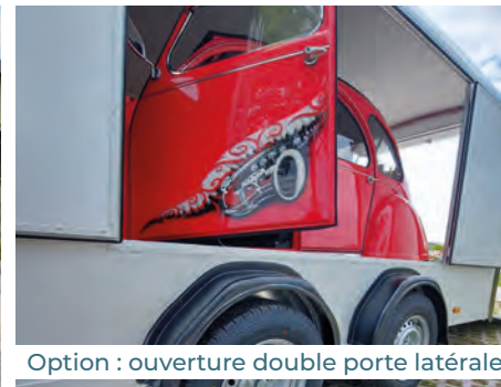
Option : ouverture double porte latérale